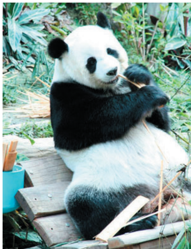
Panda i Chiang Mai Zoo, Thailand.

Pris: Gratis – der er kaffe, the, snacks og lidt kolde drikke